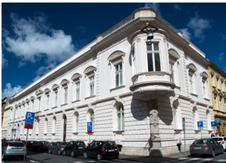
Mjesto održavanja HIS Zagreb, Berislavićeva 6